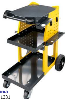
Тележка Арт.: 051331