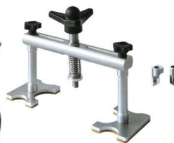
Alu Puller Арт.: 051003