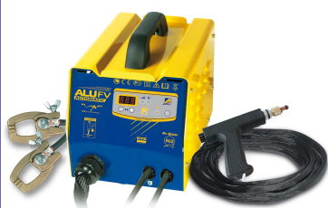
Alu Spot Арт.: 051546