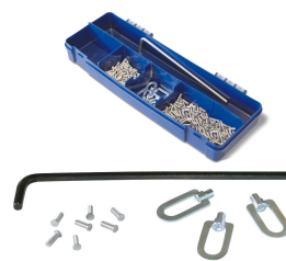
Almg X200 AlSi X200 X5